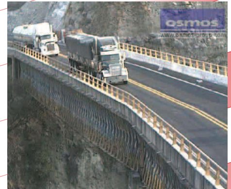
Imágenes registradas con la cámara Web instalada